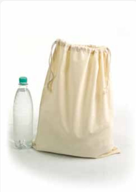
XT009 Zuziehbeutel, groß, 40 x 50 cm 100% Baumwolle ca. 40 x 50 cm