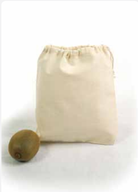
XT008 Zuziehbeutel, mittel, 17 x 20 cm 100% Baumwolle ca. 17 x 20 cm