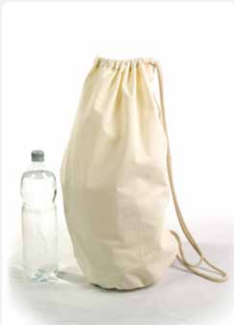
XT011 Matchesack 100% Baumwolle ca. 38 x 56 cm