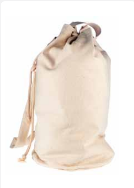
XT014 Canvas Seesack 100% Baumwolle ca. 40 x 52 cm, Bodendurchmesser: 28 cm