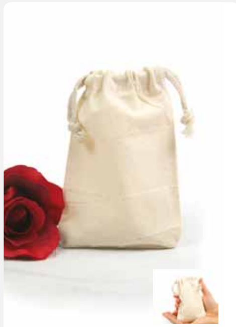
XT007 Zuziehbeutel klein, 10 x 14 cm 100% Baumwolle ca. 10 x 14 cm