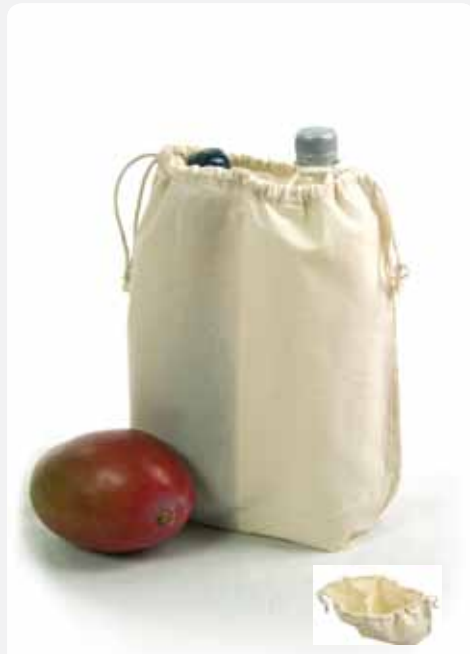
XT010 Zuziehbeutel mit Mittelsteg / Schuhbeutel 100% Baumwolle ca. 28 x 32 x 10 cm