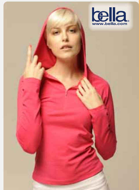
N3217 Damen Break Kapuzensweater 80% Baumwolle/20% Polyester S, M, L, XL 280 g/m 2